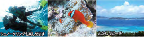
シュノーケリングも楽しめます とかしくビーチ

海水浴ツアーでは、ゆっくり海水浴を満喫したり、レンタル等もあるのでシュノーケリングをしたり! レンタル等もあるのでシュノーケリングをしたり! シュノーケルツアーではとかしくビーチでインストラクターと一緒にウミガメ探し! ウミガメに会える確率はなんと90%!!